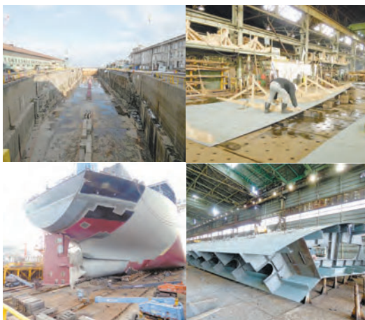
(左上から時計回り)近代化産業遺産の第1号乾ドック、組立作業が盛んな巨大なブロック、船が作られるように組まれたプロセッサ、溶接された大きなブロック、船が作られる

プラマック切断機3基、フレームプレナー1基が設置されており、幅5000ミリ、長さ1万4000ミリ、厚さ32ミリの鋼板が切断され、曲げ加工のS12工場に運ばれる。曲げ加工の撓鉄(きょうてつ)作業には驚