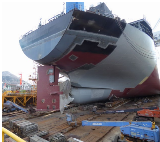
船台で組み上げられた船体 （記事より抜粋）